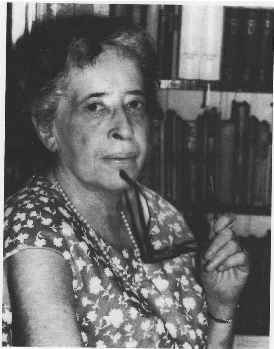
LÁMINAS 13 y 14 – Hannah Arendt, 1966