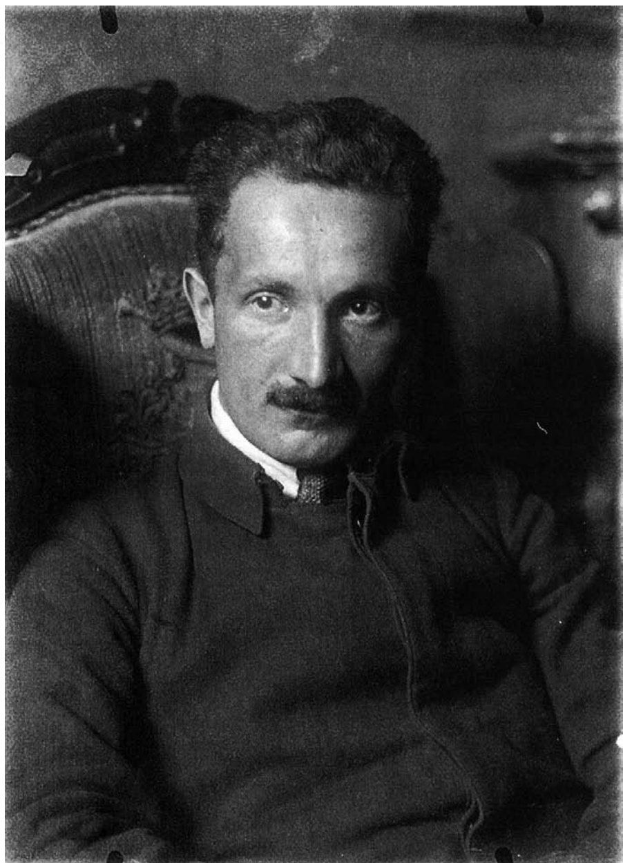
LÁMINA 3 – Martin Heidegger hacia 1920.