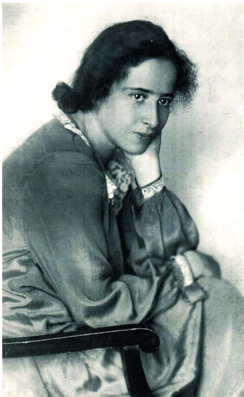
LÁMINA 2 – Hannah Arendt hacia 1925 (véase págs. 58, 263 de la presente edición).