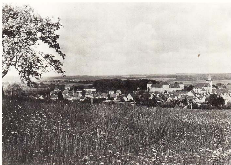
LÁMINA 8 – En julio de 1950, Martin Heidegger envió una fotografía de su ciudad natal y añadió: «En la pequeña fotografía de Messkirch ves la torre de la iglesia al lado del castillo; allí arriba habitaba mucho tiempo entre grajos y vencejos y soñaba mirando el campo. A la izquierda está el castillo en que el conde Werner von Zimmern escribió la crónica de Zimmer. Detrás, el jardín de los tilos y luego, a la izquierda, el camino vecinal que va hacia el margen de la imagen» ( véase pág. 108 de la presente edición ).